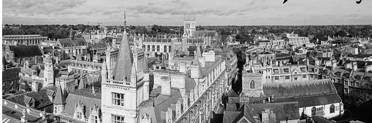
The day we arrived at Cambridge, the British Council put us up in a hotel for three days and asked us to find accommodation