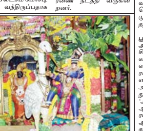
ங்கதாதர் கோவிலில் பரமபத நாதர் சன்னதியில் உள்ள கண்ணாடி ஆண்டாள் ராத பாவை நோன்பின் 13ம் நாளான இன்று "புள்ளின்வாய் கீண்டானைப் பொல்லா தொடங்கும் திருப்பாவை பாசார்த்துக்கு ஏற்ப "பகாசுர வதம்" போன்ற அலங்காரம் அறையில் மார்கழிமாத பாவை நோன்பின் 13ம் நாஎ அரக்கனை" என்று தொடங்கும் திருப்பாவை பாசுர செய்யப்பட்டிருந்த காட்சியை படத்தில் காணலாம்

தரபாலாஜ தரபாவ புகார் கொடுத்தவர்களை சந் நித்து சமரச முயற்சி எடுக் கப்படுவதாகவும் போலீ சாருக்கு கடைத்துள்ளன. இதுகு றித்தும் போலீசார் விசா ரணை நடத்தி வருகின் சலர்